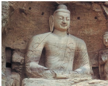
Εικόνα 36.1: Από τις θρησκείες της Ασίας

Παρατηρήστε τις παρακάτω εικόνες και προσπαθήστε να βρείτε ποιους λαούς χαρακτηρίζουν. Γνωρίζετε κάτι για τους λαούς αυτούς;