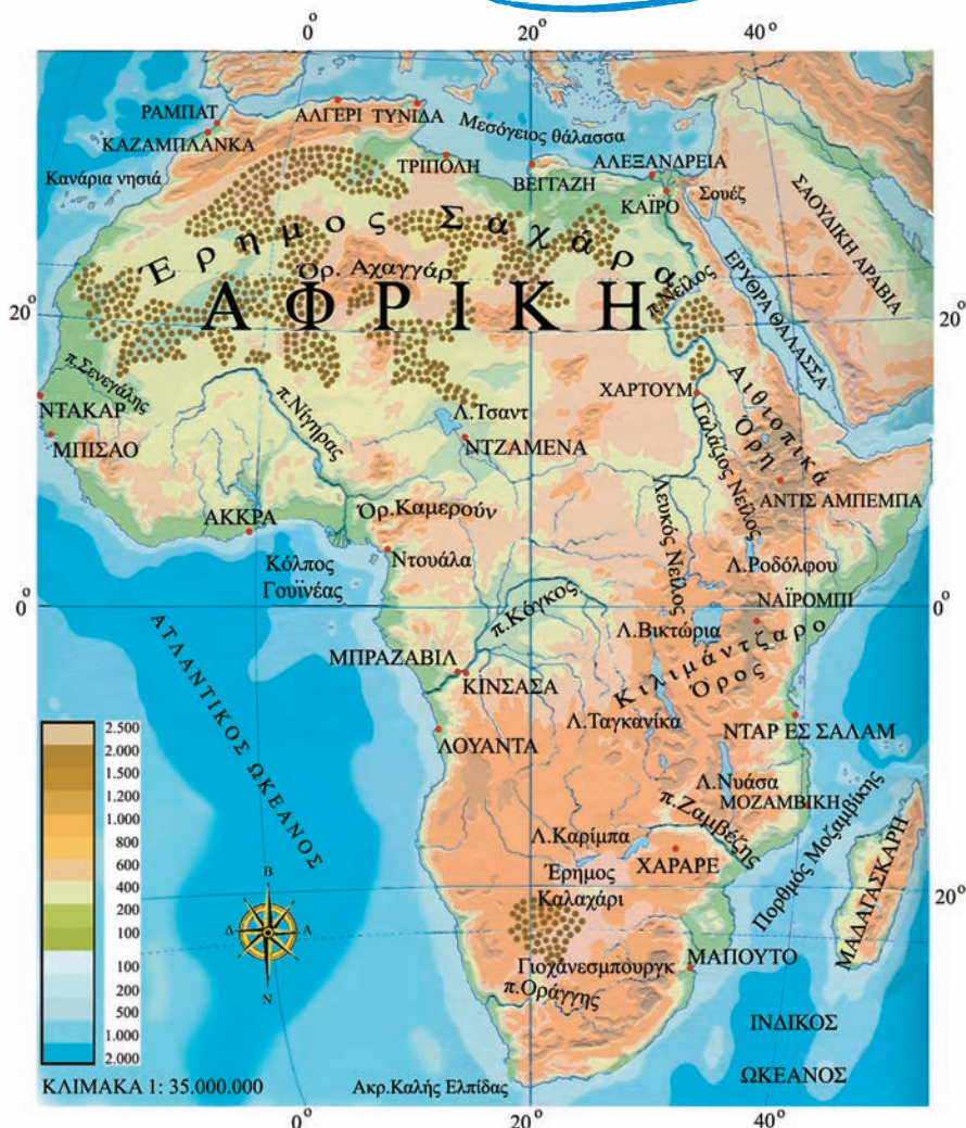
Εικόνα 37.1: Γεωμορφολογικός χάρτης της Αφρικής