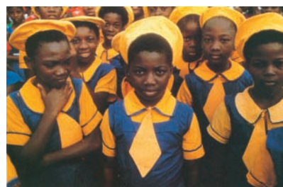
Εικόνα 38.5: Στο σχολείο του Λάγος της Νιγηρίας

Στην Κεντρική Αφρική κυρίως κατοικούν μαύροι ιθαγενείς, οι οποίοι δέχθηκαν έντονες επιρροές από την αποικιοκρατία των Ευρωπαίων, καθώς και από τις χώρες της Αραβίας και της Ινδίας. Πολλές από τις χώρες της Κεντρικής Αφρικής ανήκουν σε αυτές που ονομάζουμε «χώρες του Τρίτου Κόσμου», επειδή είναι οι πιο φτωχές του κόσμου. Πείνα, αρρώστιες, ιδιαίτερα το Α.Ι.Δ.Σ., έλλειψη νερού και φαρμάκων οδηγούν τους κατοίκους σε αφανισμό, παρά το μεγάλο αριθμό των γεννήσεων.