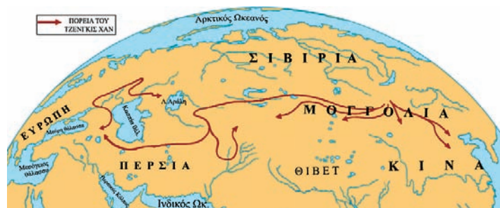
Εικόνα 36.6: Κατακτητική πορεία Χαν.