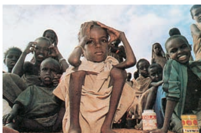
Εικόνα 38.4: Λιμός στη Σομαλία