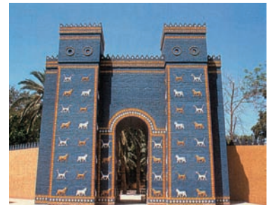
Εικόνα 36.3: Βαβυλώνα, η πύλη της Ιστιάρ

Η Ασία είναι η ήπειρος, στην οποία αναπτύχθηκαν σπουδαίοι αρχαίοι πολιτισμοί. Θεωρείται κοιτίδα των μεγάλων θρησκειών και πολιτισμών. Στην ήπειρο αυτή, όπου ομιλούνται εκατοντάδες γλώσσες, συναντάμε σχεδόν όλες τις φυλές του κόσμου και πολλές θρησκείες. Ο τρόπος ζωής κάθε λαού είναι εντελώς διαφορετικός και εξαρτάται από το κλίμα, τη μορφολογία του εδάφους, την πυκνότητα του πληθυσμού, την ανάπτυξη της οικονομίας, τη θρησκεία, τη μόρφωση και φυσικά τα διαφορετικά ήθη και έθιμα.