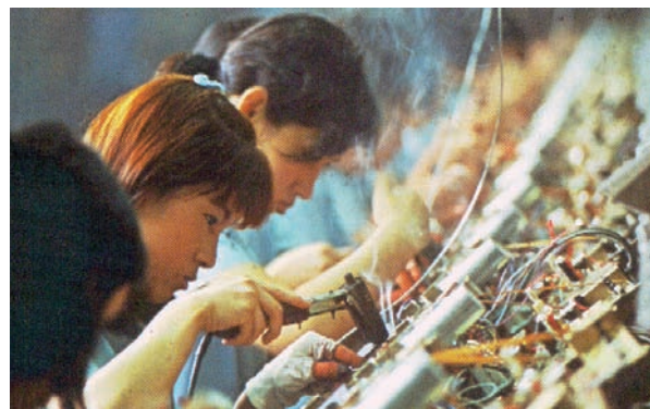
Εικόνα 35.3: Ιαπωνέζες στη Βιομηχανία ηλεκτρονικών προϊόντων

Η Νοτιοανατολική Ασία είναι επίσης πυκνοκατοικημένη περιοχή. Παρά τις εύφορες πεδινές εκτάσεις και την ομαλή μορφολογία του εδάφους το βιοτικό επίπεδο είναι πολύ χαμηλό. Εξαιρεση αποτελεί η Σιγκαπούρη, η οποία έχει παρουσιάσει ταχύτατους ρυθμούς ανάπτυξης. Σημαντικός λόγος για την οικονομική καθυστέρηση της περιοχής αυτής είναι το καθεστώς της αποικιοκρατίας. Τα κράτη της Ν.Α. Ασίας απέκτησαν την ανεξαρτησία τους κατά τη δεκαετία του 1950.