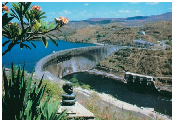
Εικόνα 37.3: Το φράγμα στον Ζαμβέζη, Ζιμπάμπουε

Το υδρογραφικό δίκτυο της Αφρικής αποτελείται από πολλές μεγάλες λίμνες, όπως είναι η Βικτόρια, η Ταγκανίκα, η Νυάσσα, η Τσαντ και άλλες, καθώς επίσης και από γνωστούς ποταμούς.