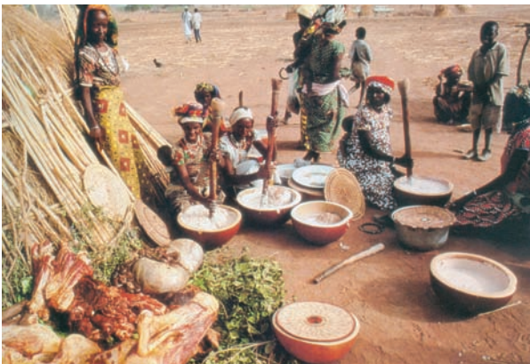
Εικόνα 38.1: Νομάδες στο Φουλάνι Δυτ. Αφρικής