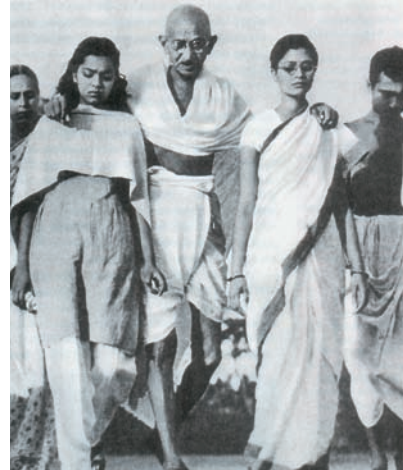
Εικόνα 36.4: Μαχάτμα Γκάντι

Τον 13ο αιώνα μ.Χ. οι Μογγόλοι με αρχηγό τον Τζέκινς Χαν δημιούργησαν τη μεγαλύτερη αυτοκρατορία εκείνης της εποχής. Ας ακολουθήσουμε μαζί την κατακτητική πορεία τους στο χάρτη της διπλανής εικόνας. Ας συζητήσουμε γιατί δεν επηρέασαν πολιτιστικά τις περιοχές που είχαν κατακτήσει.