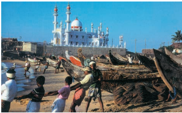
Εικόνα 35.2: Ψαράδες της Ινδίας

Ας συγκρίνουμε τους λαούς της Ινδίας και της Ιαπωνίας και ας επισημάνουμε τις διαφορές τους.