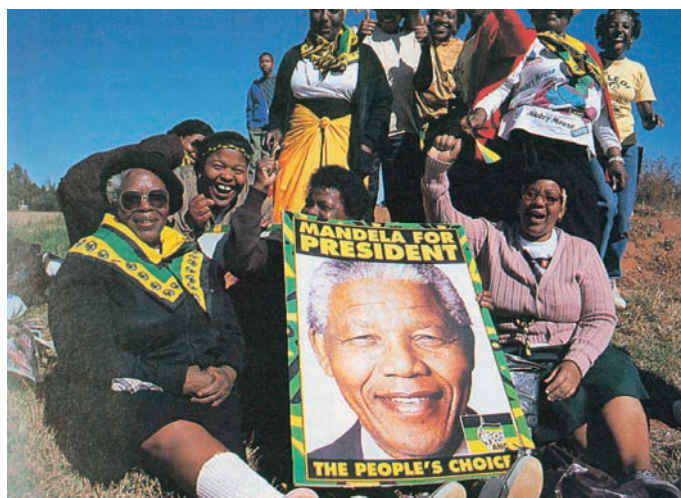
Εικόνα 38.6: Νέλσον Μαντέλα

Σήμερα η Αφρική αποτελείται από περισσότερα από 55 κράτη, πολλά από τα οποία απέκτησαν την ανεξαρτησία τους κατά τις τελευταίες δεκαετίες. Τα κράτη κυρίως της Κεντρικής Αφρικής είναι αραιοκατοικημένα εξαιτίας των δύσκολων κλιματικών συνθηκών που επικρατούν εκεί.