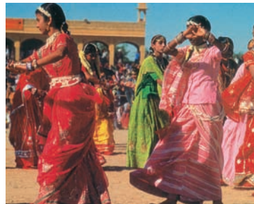
Εικόνα 36.2: Από τον πολιτισμό της Ασίας