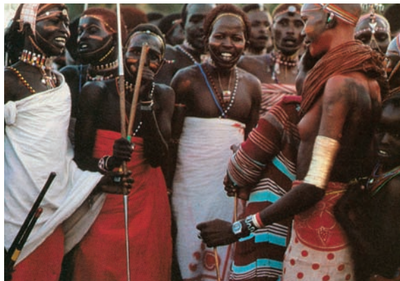
Εικόνα 38.2: Οι φυλές Κικουγιού και Μασάι της Κένυας

Ας συζητήσουμε μαζί γιατί στην Αφρική συναντάμε τόσο μεγάλη ποικιλία εθίμων, συνθειών και πολιτισμών, στοιχεία τα οποία τη χαρακτηρίζουν ως «μωσαϊκό φυλών και εθνοτήτων».