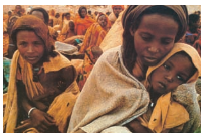
Εικόνα 38.3: Καταυλισμός προσφύγων της Σομαλίας