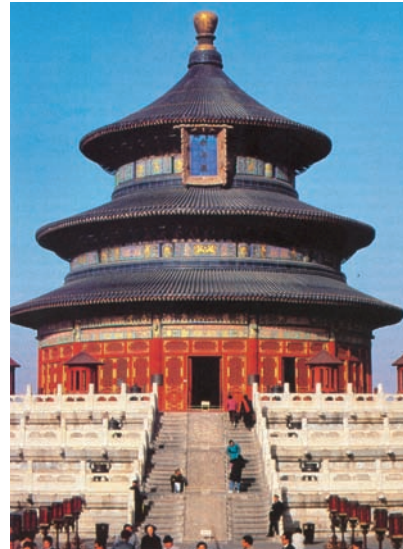
Εικόνα 36.5: Ο ναός του Ουρανού. Κομφουκιανικό τέμενος στο Πεκίνο.